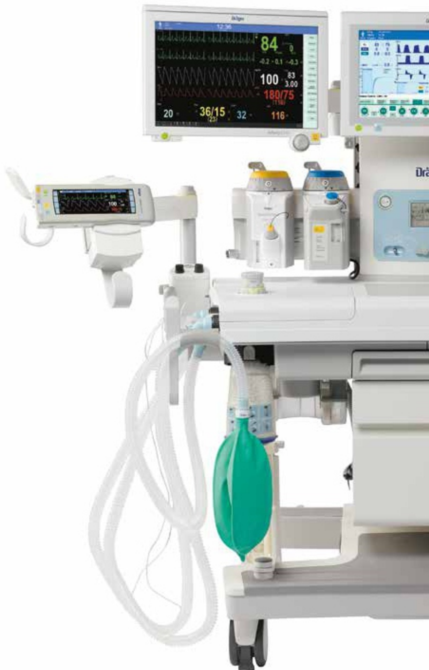
Аппарат Perseus® A500 включает систему мониторинга

Крючки и держатели для использования и установки шлангов и кабелей, ящики и полки для оптимального хранения необходимых материалов