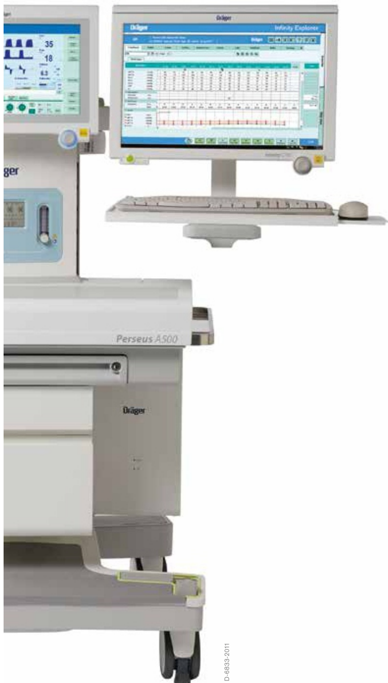
IACS с C700 для решения ИТ-задач

Различные кронштейны и направляющие для любого размещения мониторов, ИТ-оборудования, инфузионных насосов и дополнительных полок